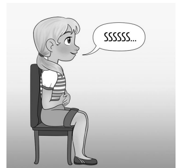
Illustration : https://sympa-sympa.com